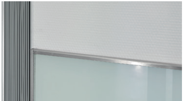
Integration einer Dehnungsfuge und vertikales Abschlussprofil