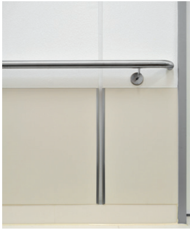
Integration einer Dehnungsfuge