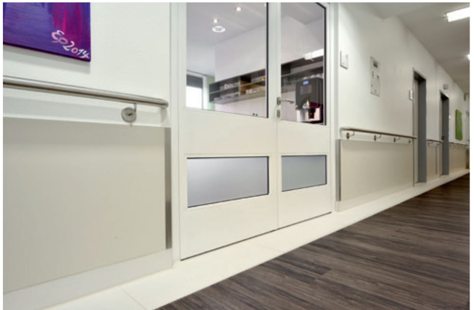
Einsatz einer satinierten Sichtschutzfolie