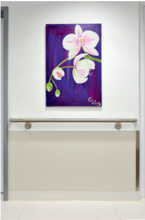
Wandschutz mit WEBAMED-Edelstahl-Handlauf